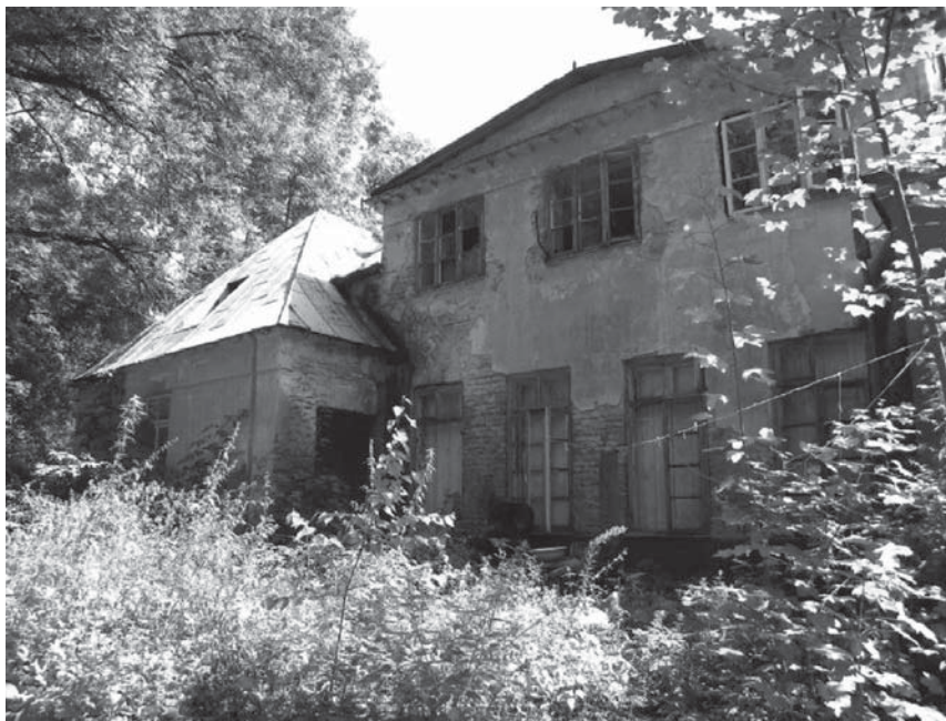
Rys. 2. Dwór w Ciechankach – elewacja ogrodowa, stan w 2011 r. Fig. 2. Second Mansion in Ciechanki – garden elevation in 2011

Na podstawie inwentaryzacji przeprowadzonej w 2011 r. stwierdzono, że attyka elewacji ogrodowej również została profilaktycznie rozebrana. Odsłonięty został odbojnik, pod którym wymurowano trójkąt tympanonu, dziwacznie prezentującego się w obiekcie modernistycznym. Kąt nachylenia płaszczyzn odbojnika nie przekracza 15^\circ , co powoduje jeszcze większy zamęt kompozycyjny w obrębie dachu niż dobudowane lukarny. Prostokątne drewniane płytki i trójkąt pod odbojnikiem przypominają rozwiązania klasycystyczne (rys. 2).