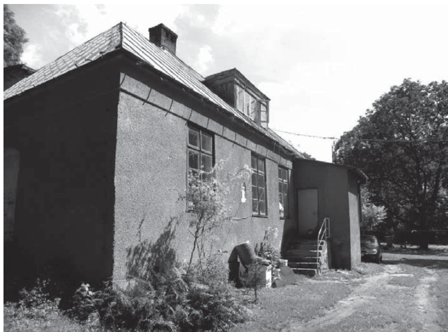
Rys. 3. Dwór w Ciechankach – fasada południowo-zachodnia, stan w 2011 r.