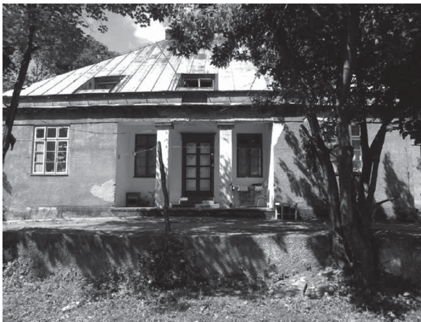
Rys. 1. Dwór w Ciechankach – elewacja frontowa, wejście do budynku, stan w 2011 r.

jąc główne drzwi zewnętrzne. Kompozycję wejścia dopełniają dwie kolumny o przekroju kwadratowym. Słupy są proste, bez zdobień; usytuowane bezpośrednio na płaszczyźnie podestu wnęki, nie mają baz wzorem porządku doryckiego. Jediną formą zdobienia jest głowica wykonana z dwóch płytek prostopadłościennych z wąską poziomą szczeliną między nimi (następne nawiązanie do porządku doryckiego) (rys. 1).