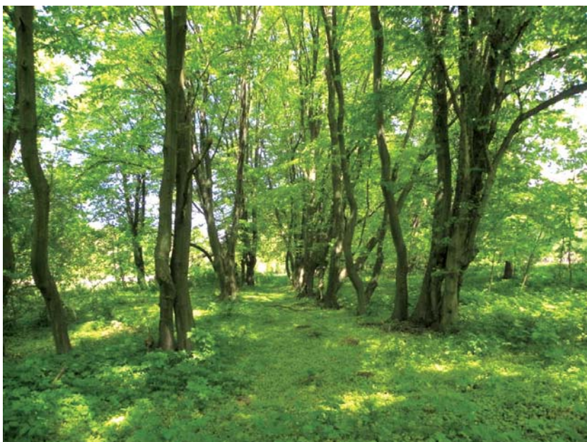
Ryc. 2. Widok na aleję grabową w parku kaligraficznym, stan w 2011 r. Fig. 2. View of the hornbeam alley in the park calligraphy in 2011