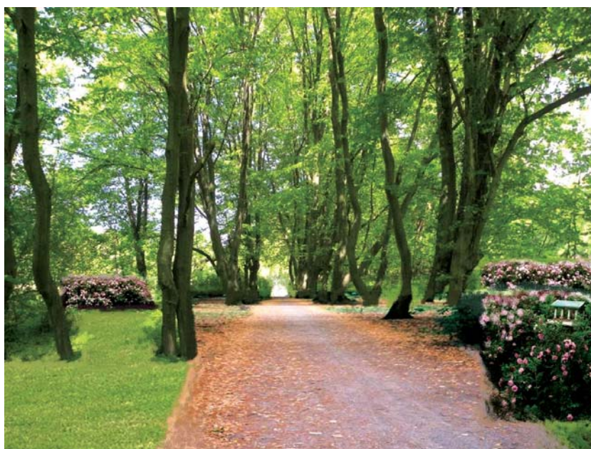
Ryc. 3. Wizualizacja odnowionej alei grabowej w parku kaligraficznym (oprac. M. Dudkiewicz) Fig. 3. Visualization renewed hornbeam alley in the park calligraphy (by M. Dudkiewicz)