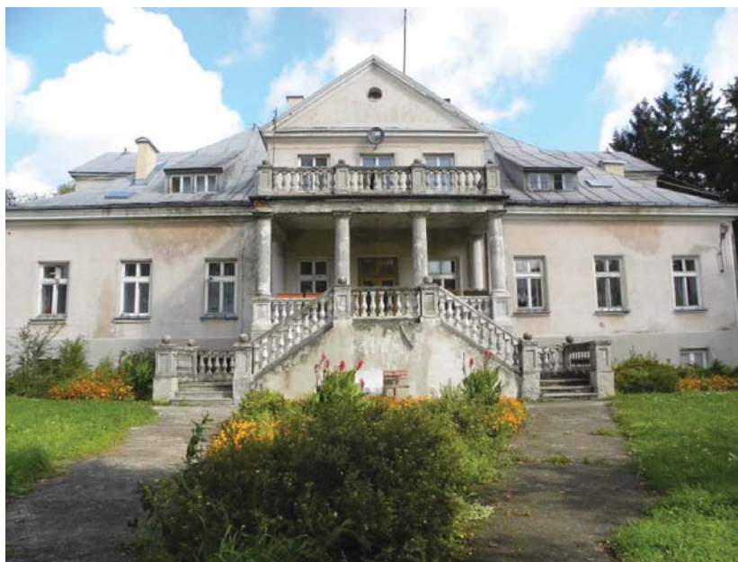
Ryc. 4. Widok na pałac od strony salonu ogrodowego, stan w 2011 r. Fig. 4. View of the palace garden from the garden in 2011