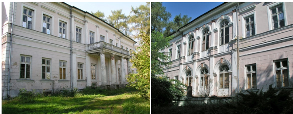
Ryc. 3. Stan obecny pałacu – elewacja frontowa i elewacja ogrodowa Fig. 3. The present state of the palace – front elevation and elevation garden