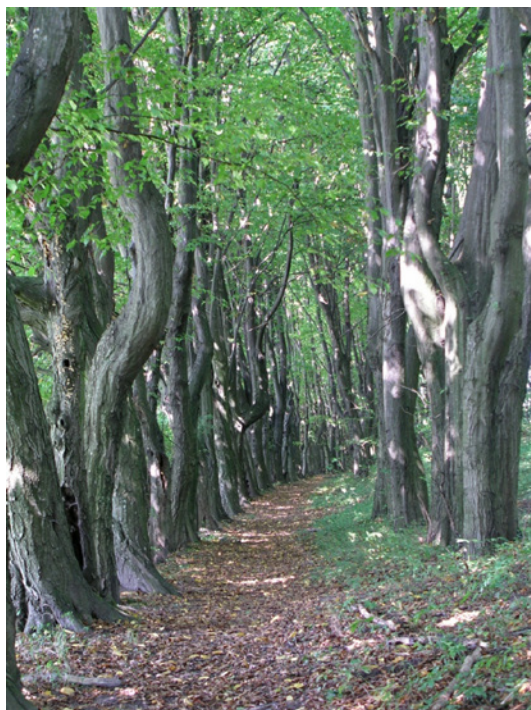
Ryc. 4. Widok na aleję grabową okalającą park – stan na 2014 rok Fig. 4. View of the circumflex hornbeam avenue park in 2014

W 2013 roku na terenie parku zinwentaryzowano 1265 drzew i krzewów (tab. 1). Największy udział w drzewostanie ma grab pospolity ( Carpinus betulus L.). W parku rosną 554 okazy tego gatunku, co stanowi 44% zadrzewień. Drugim pod względem liczebności gatunkiem jest lipa drobnolistna ( Tilia cordata Mill.) z udziałem 10,6%, a kolejnym topola biała ( Populus alba L.) reprezentowana przez 92 okazy, co stanowi