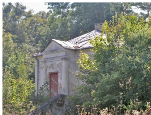
Ryc. 2. Stan obecny oficyn