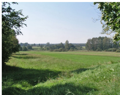
Ryc. 1. Widok na okoliczne łąki